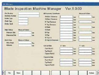
操作画面の一部 / Operating screen display (Data entry)